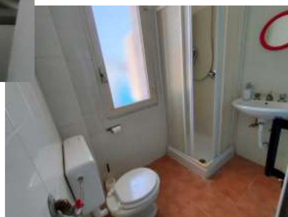
GIU': BAGNO CON DOCCIA