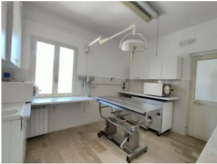
SALA PREPARAZIONI INTERVENTI