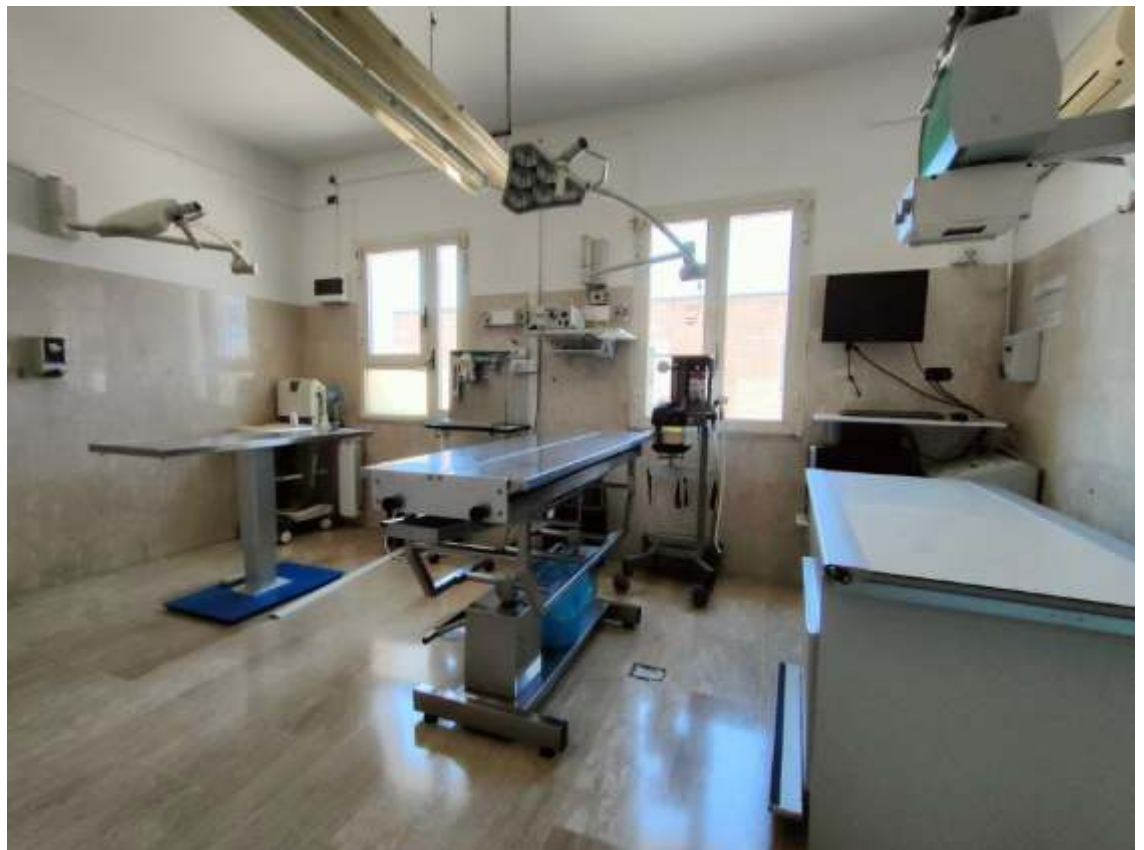
SALA OPERATORIA CON RADIOGRAFIA DIGITALE DIRETTA ED ECOGRAFIA