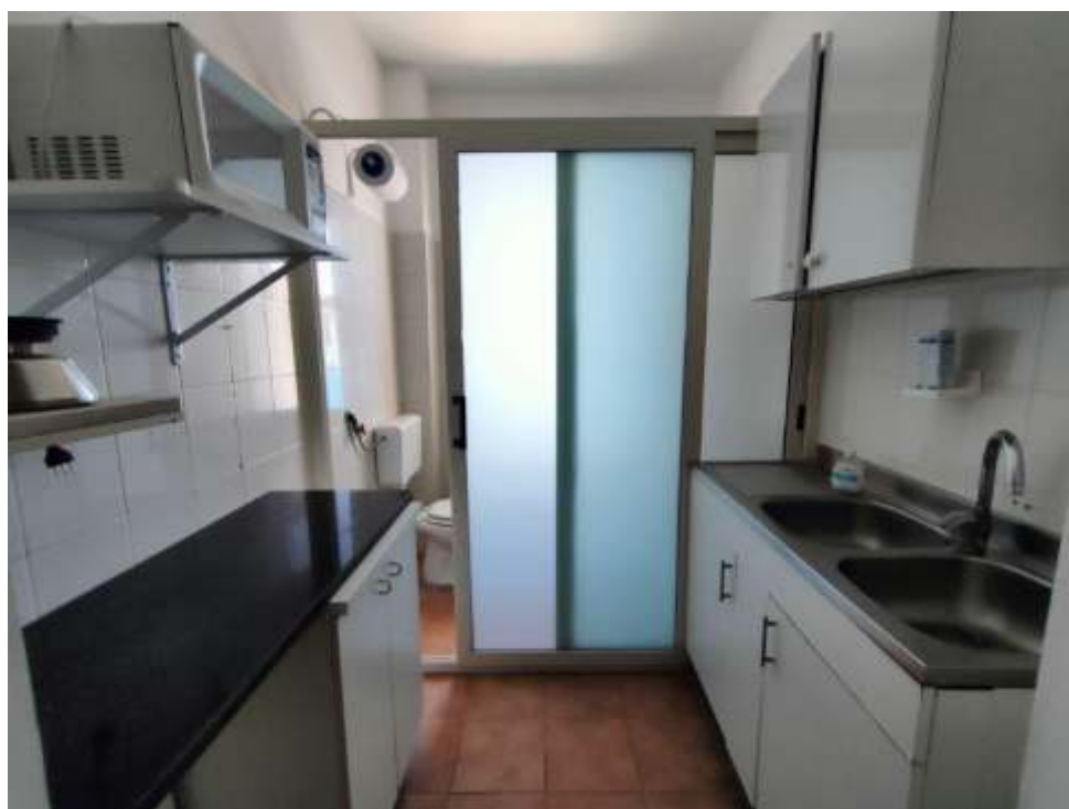
SINISTRA: ANTIBAGNO CON POSTICINO "RISTORO"