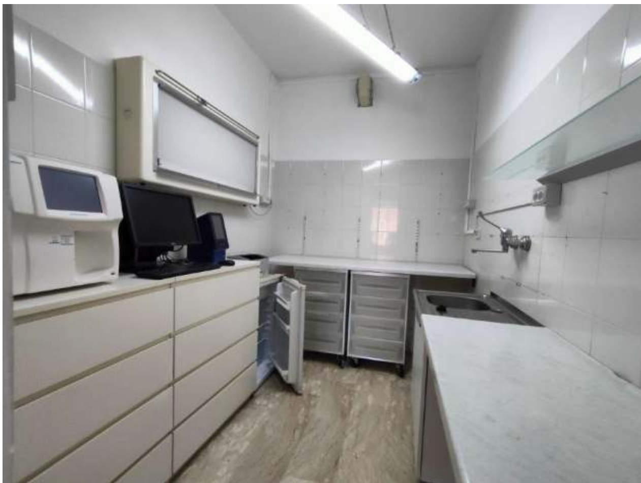
LABORATORIO DI ANALISI (MANCANO LA CENTRIFUGA E IL MICROSCOPIO)