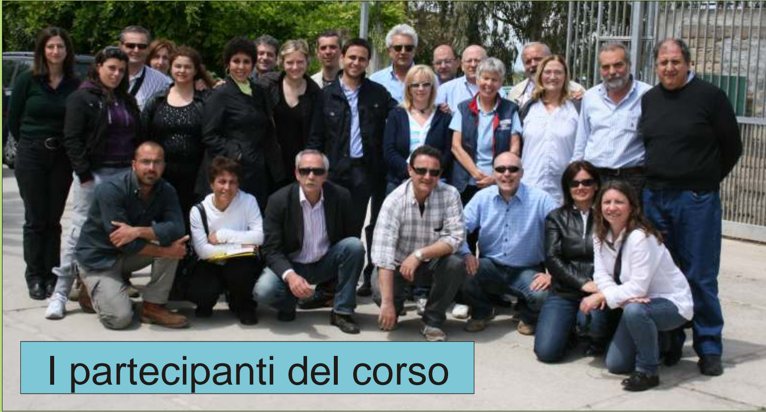
I partecipanti del corso

destinato a veterinari che lavorano nel settore