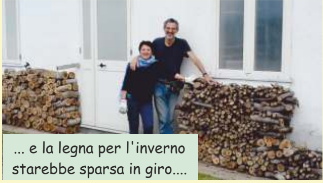
... e la legna per l'inverno starebbe sparsa in giro....