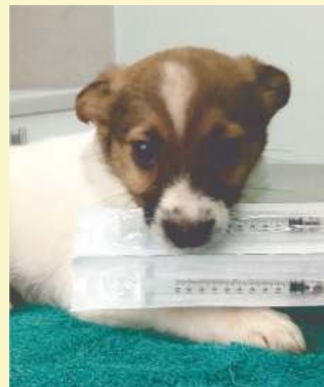
IL NOSTRO NUOVO "ASSISTENTE" A ROCCA D'EVANDRO ....