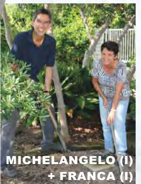
MICHELANGELO (I) + FRANCA (I)