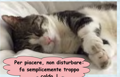
Per piacere, non disturbare: fa semplicemente troppo caldo...!

I migliori saluti e auguri da un Sud Italia bollente