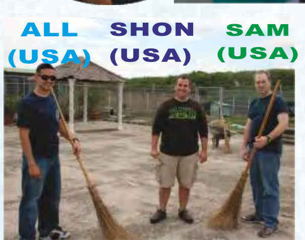
ALL SHON SAM (USA) (USA) (USA)