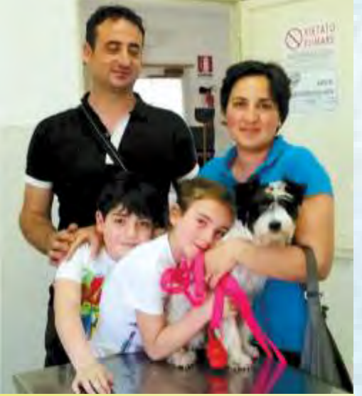
Cimmi, il cucciolo abbandonato nel cimitero di Rocca d'Evandro, è tornato a farci visita per il vaccino. La fotografia non ha bisogno di commenti!