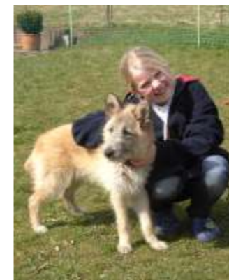
Circe, ora chiamata Paula, in Germania!

Ma nonostante tutto il vento sta cambiando! I proprietari di cani e gatti castrati sono ormai migliaia. E non solo dalla nostra clinica. Tutti i veterinari sono all'opera! Ma gli animali castrati non sono ancora abbastanza. Il tasso di proliferazione è ancora troppo alto. Cio nonostante dobbiamo continuare, dobbiamo "chiudere il rubinetto" fino che le "poche gocce" residue possano facilmente trovare sistemazione. I canili, anche se ben tenuti, non sono il posto dove gli animali dovrebbero vivere. Sono necessari come luogo di sosta temporaneo fino a che non si trovi una nuova famiglia che soddisfi i loro fabbisogni psicofisiologici. Forse mi sbaglio, ma qualche volta ho l'impressione che i "protettori" degli animali siano i loro più grandi (Segue su l'ultima pagina....)i