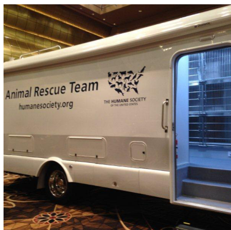
TIR ATREZZATO UTILIZZATO IN EMERGENZA