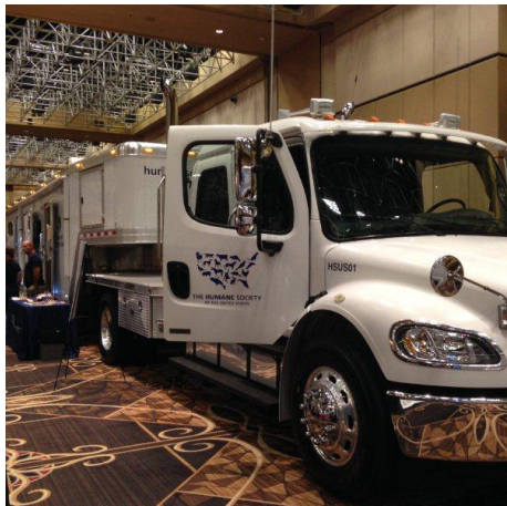
TIR ATREZZATO UTILIZZATO IN EMERGENZA