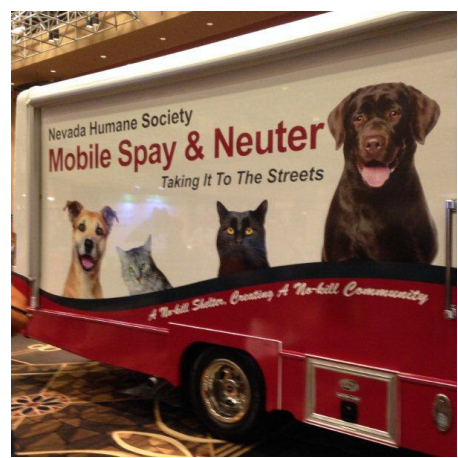
CLINICA VETERINARIA MOBILE PER LA STERILIZZAZIONE DI CANI E GATTI